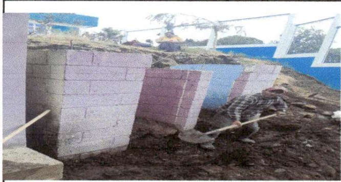
Foto7: sustitución de Piso de Concreto de servicio sanitario.