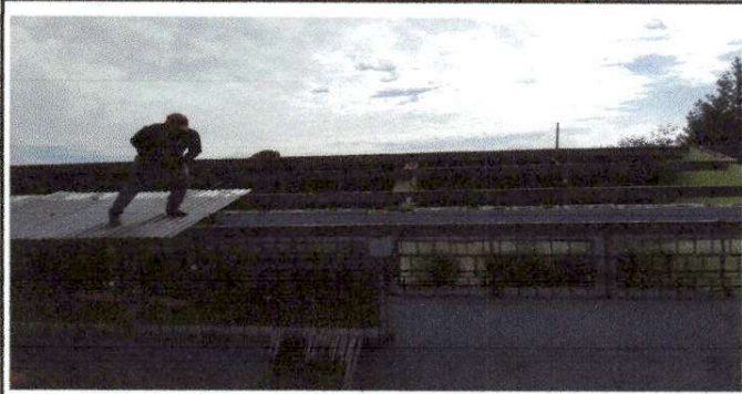
Foto1: Sustitución de Lamina, por lamina troquelada alucinc calibre 26